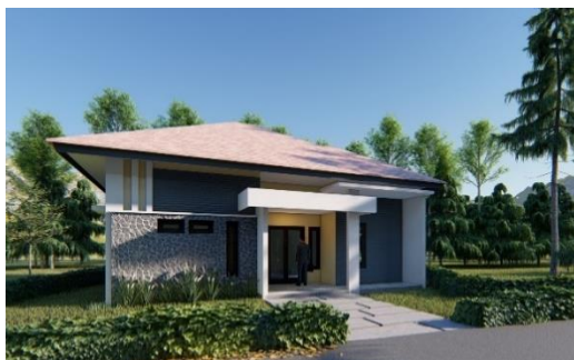
Gambar 2. Gambar Rencana 3 Dimensi Bangunan yang ditinjau

Analisis dilakukan pada perencanaan proyek konstruksi gedung dengan luas lantai sekitar 100 m 2 , bangunan terdiri atas 1 lantai, pondasi yang digunakan yaitu pondasi batu kali, dinding menggunakan bata merah, rangka atap berupa rangka baja ringan dengan penutup atap spandek, plafond menggunakan rangka besi hollow dan penutup plafond gypsum .