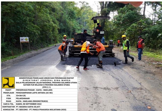
Gambar 2. Penghamparan AC-BC

Pada Paket Preservasi Jalan Poigar-Kaiya-Maelang, tebal rencana AC-BC menurut JMF ( Job Mix Formula ) adalah 6 cm.