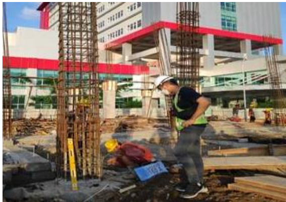
Gambar 5. Proses Pekerjaan Bekisting Kolom

Metode bekisting pada pembangunan BKIA RSUD Provinsi Sulawesi Utara dengan material utama beton adalah dengan menggunakan metode bekisting atau cetakan beton konvensional. Bahan yang digunakan pada bekisting konvensional adalah kayu, multiplex , papan, dan paku yang mudah didapat. Metode bekisting konvensional ini kelemahan utamanya yaitu tidak bertahan lama atau berumur lebih pendek.