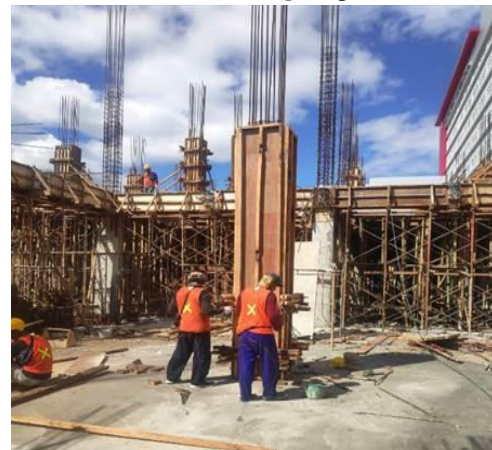
Gambar 7. Proses Pekerjaan Pembongkaran Bekisting