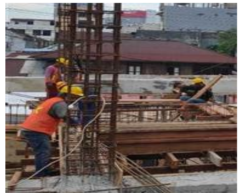
Gambar 9. Proses Pekerjaan Pembesian Balok

Pekerjaan pembesian balok dilakukan saat bodeman sudah terpasang. Besi balok dipasang sesuai gambar shop drawing . Pada proyek BKIA RSUD Provinsi Sulawesi Utara safety first , jadi pada pekerjaan pemasangan tulangan balok perlengkapan safety harus dikenakan.