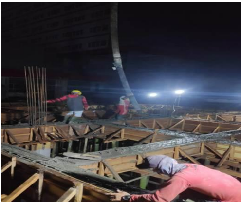
Gambar 11. Proses Pekerjaan Pengecoran Balok

Setelah bekisting balok selesai baru bisa dilakukan pengecoran balok. Gambar 11 merupakan dokumentasi pada saat pengecoran balok lantai 2 pada elevasi 3,95 meter di proyek pembangunan balai Kesehatan Ibu dan Anak (BKIA) RSUD Provinsi Sulawesi Utara.