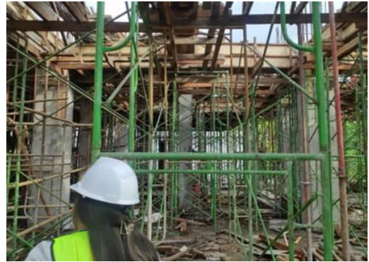
Gambar 12. Proses Pekerjaan Perancah

pelat lantai dari lantai 2. Perancah yang digunakan pada pelat lantai sebagian besar menggunakan scaffolding dan diperkuat dengan bambu dan balok kayu. Gambar 12 merupakan perancah di lokasi proyek BKIA RSUD Sulawesi Utara.