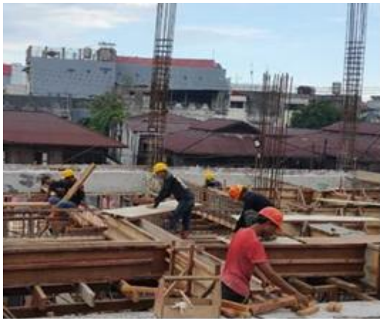
Gambar 10. Proses Pekerjaan Bekisting Balok