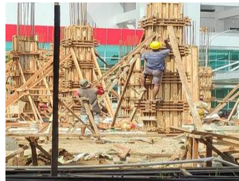
Gambar 4. Proses Pekerjaan Pemasangan Tulangan Kolom

Setelah pekerjaan marking selesai, yaitu pemasangan rangkaian besi kolom pada titik kolom yang direncanakan atau diberi tanda pada pekerjaan marking dengan menggunakan kawat bendrat, ikat tulangan pokok overlapping dengan stek penyaluran dan lengkapi besi sengkang sesuai gambar rencana. Proses pemasangan dapat dilihat pada Gambar 4.