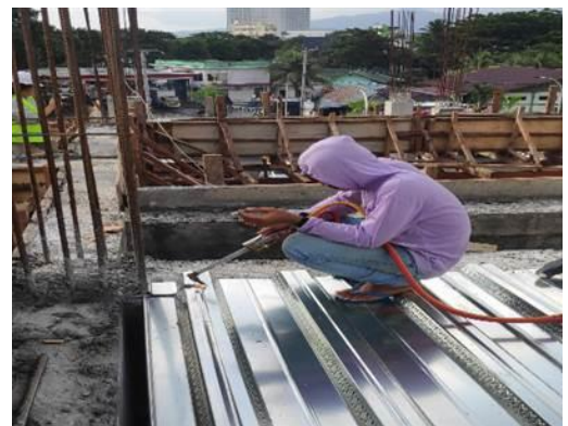
Gambar 13. Proses Pekerjaan Floordeck