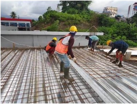
Gambar 14. Proses Pekerjaan Tulangan Wiremesh