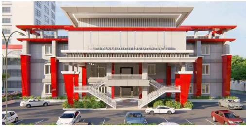
Gambar 1. Proyek BKIA

Penelitian ini dilaksanakan di proyek pembangunan Balai Kesehatan Ibu dan Anak (BKIA) RSUD Provinsi Sulawesi Utara.