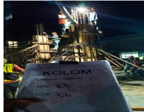
Gambar 6. Proses Pekerjaan Pengecoran Kolom