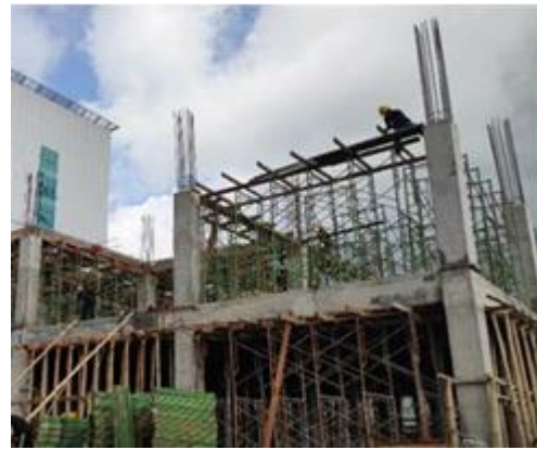
Gambar 8. Proses Pekerjaan Pasang Perancah Balok

Setelah pengukuran dan pemberian marking yaitu memasang perancah. Perancah terdiri dari tiang sokong, gelagar, balok suri, di mana gelagar menumpu pada tiang sokong, balok suri menumpu pada gelagar dan bodeman menumpu pada balok suri. Perancah pada proyek BKIA RSUD Provinsi Sulawesi Utara menggunakan sistem semi modern yaitu perancah scaffolding dan perancah bambu.