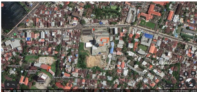
Gambar 2. Peta Lokasi Proyek BKIA